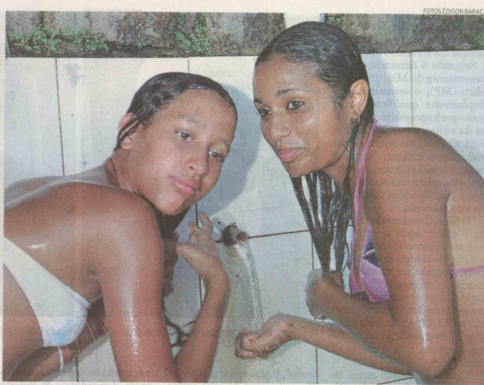
O forte calor registrado nos últimos dias tem atraído maior número de pessoas para as bicas da Cidade

A Tribuna Sexta-feira, 05 de Fevereiro de 2010