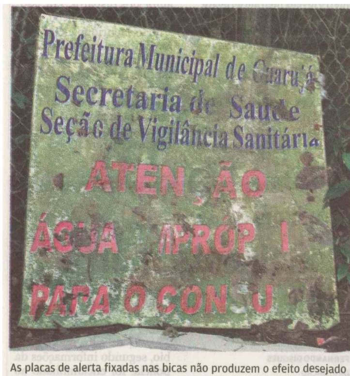
As placas de alerta fixadas nas bicas não produzem o efeito desejado